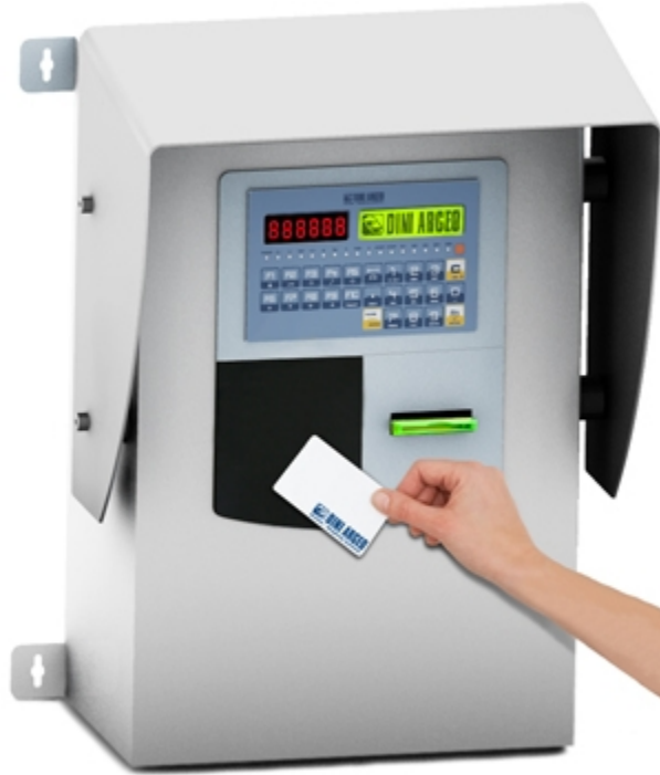
3590EBOXBDG : Système de libre service pour la gestion des ponts bascules, avec lecteur de proximité intégré.