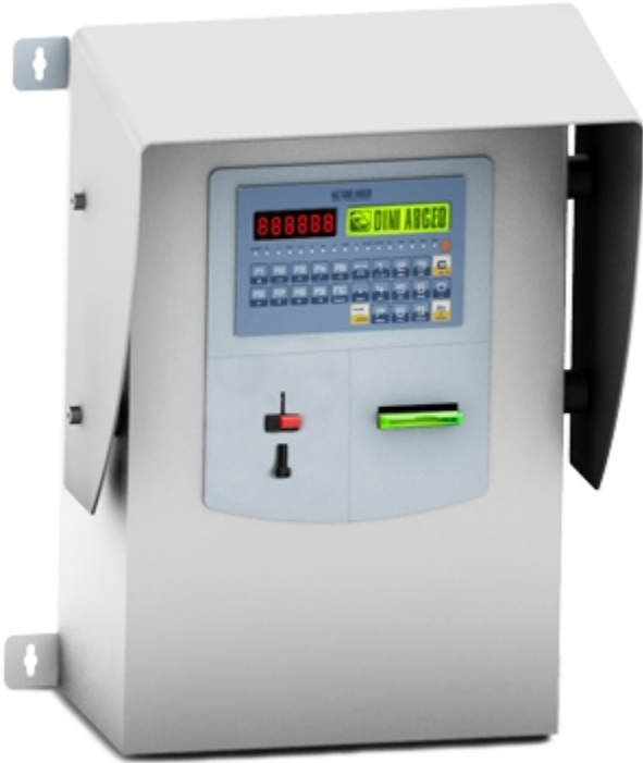
3590EBOXGET : Système de libre service pour la gestion des ponts bascules, avec monnayeur intégré.