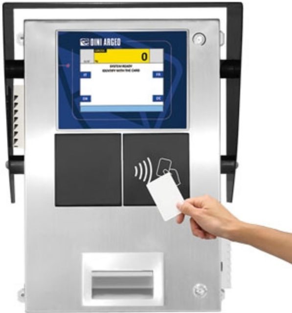
3590EGTBOX8 : avec lecteur de carte RFID.