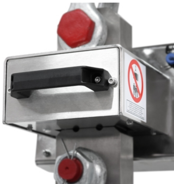
Crochet peseur MCW09: batterie extractible