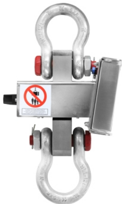
Crochet peseur MCW09: vue laterale