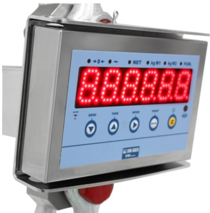
Crochet peseur MCW09: afficheur très lumineux de 40mm