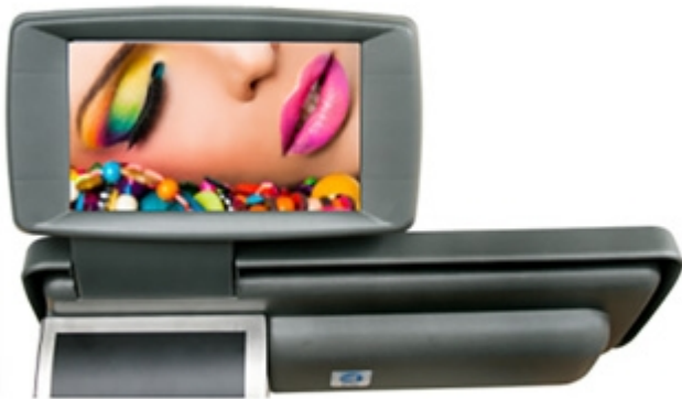
Grand écran couleur TFT 7"