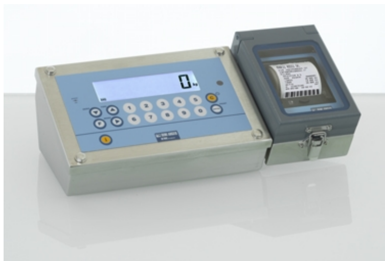
DFWKXTBC en boîtier inox IP68 avec imprimante thermique intégrée